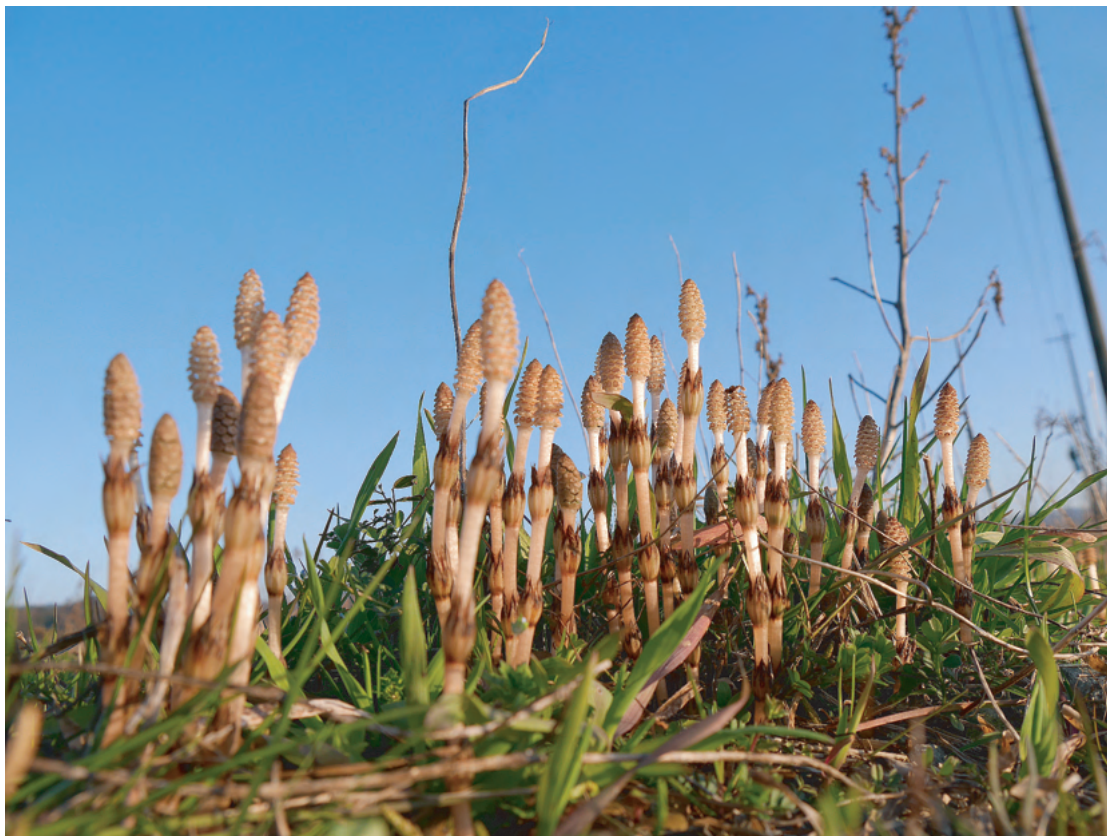
六方田んぼのつくし